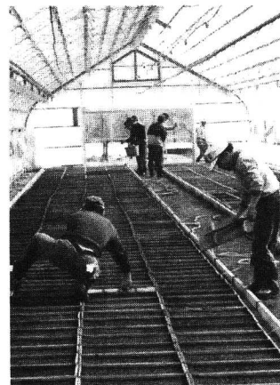
共同作業によるたばこの種まき