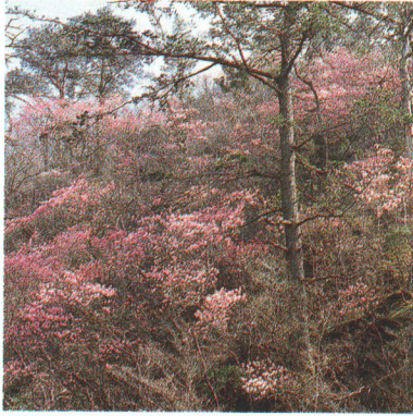
自生するアカヤシオの群落(井出川溪谷)