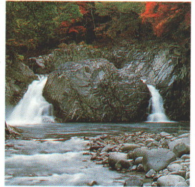
木戸川溪谷(雄滝・雌滝)