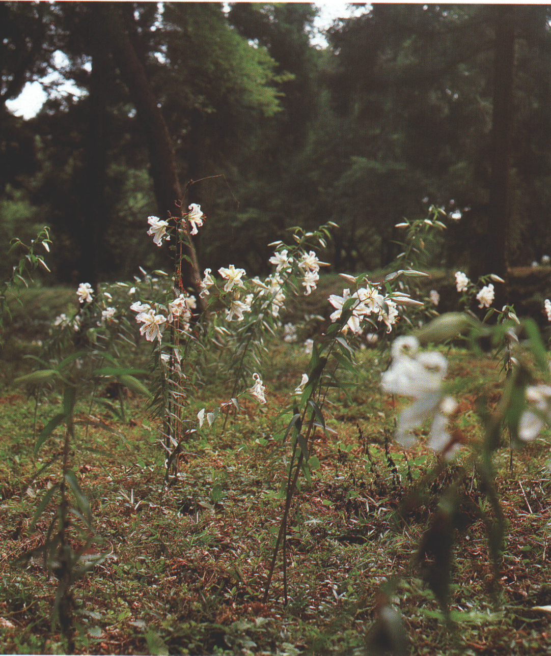
優雅に咲き誇るやまゆりの群生(天神岬スポーツ公園)