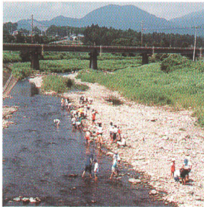
自然環境の保全(井出川)