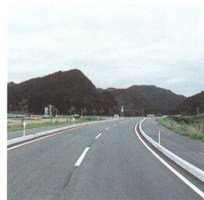
総合的な交通体系の整備