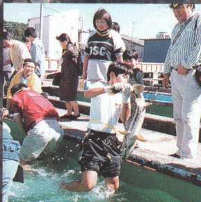
サケのつかみどり大会