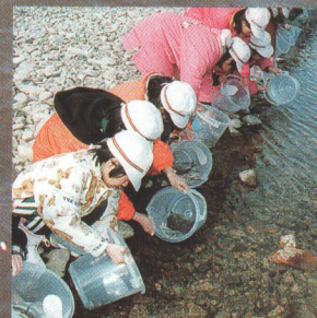
小学生によるサケの稚魚放流