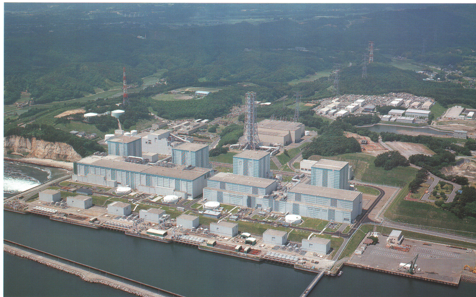
東京電力(株)福島第二原子力発電所