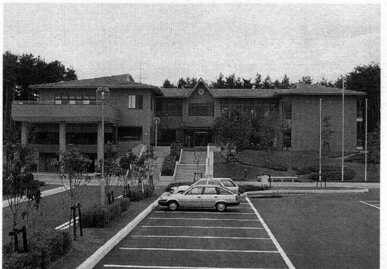
㉕ サイクリングターミナルオープン（昭和63年4月）