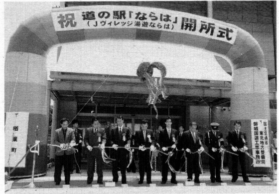
④③ 道の駅「ならは」(Jヴィレッジ湯遊ならは) オープン(平成13年6月)