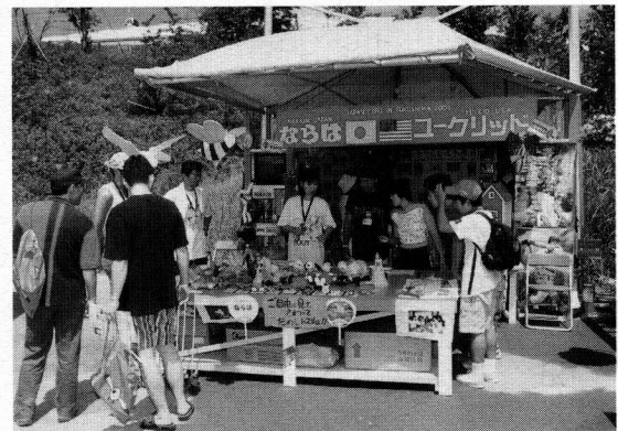
④④ うつくしま未来博に「ならはのフレンドシップハウス」出展(平成13年8月)