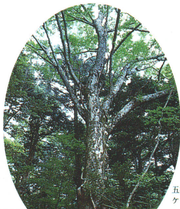
五社山山中に自生するケヤキ