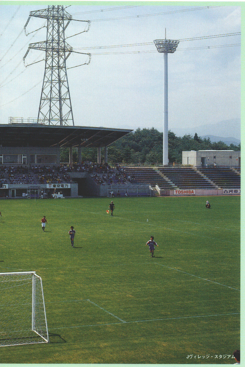
Jヴィレッジ・スタジアム