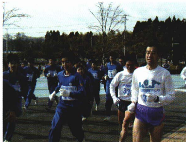
町民健康マラソン大会