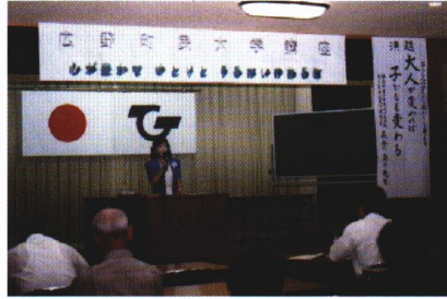
こうざ 町民大学講座