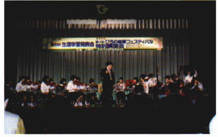
しょうがい 生涯学習発表会