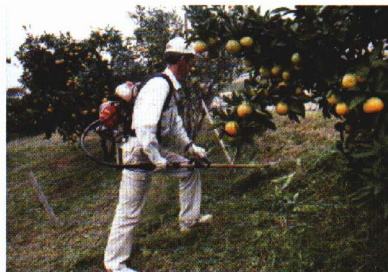
く さ か 草刈り