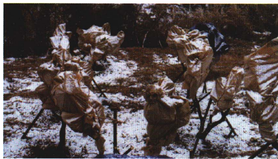
ふゆたいさく 冬対策