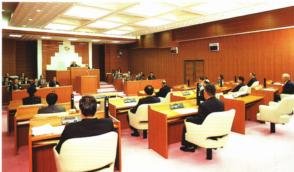
【 議事の様子 】

3月 第1回 定例会 6月 第2回 定例会 9月 第3回 定例会 12月 第4回 定例会