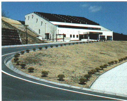
アンモナイトセンター