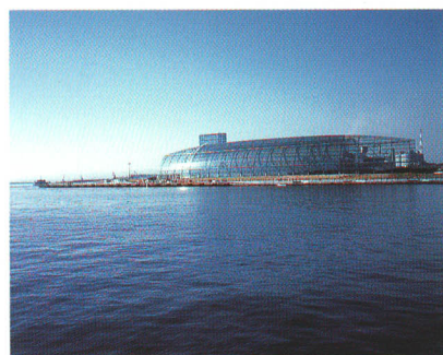
ふくしま海洋科学館「アクアマリンふくしま」