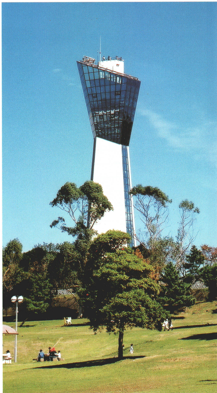
いわきマリンタワー