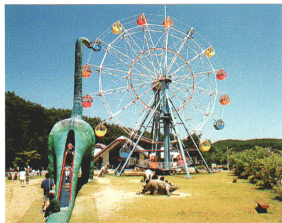
海流の里センター