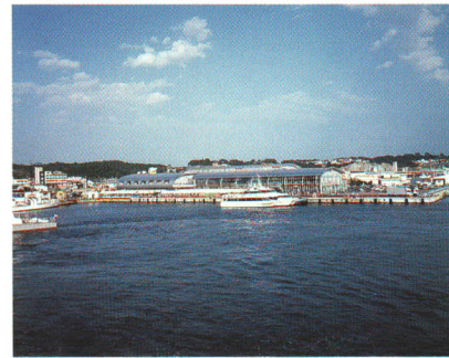
市観光物産センター「いわき・ら・ら・ミュウ」