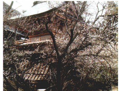
浄土宗名越派の総本山であった専称寺