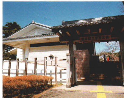
勿来関文学歴史館