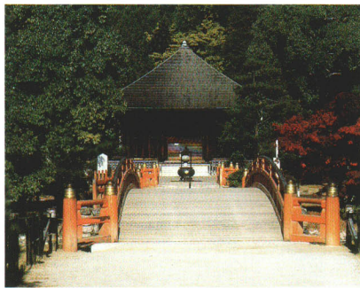
国宝 白水阿弥陀堂