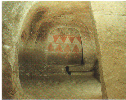
国指定史跡・中田横穴