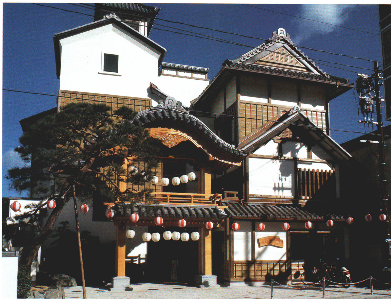
さはこの湯温泉保養所（いわき湯本温泉）