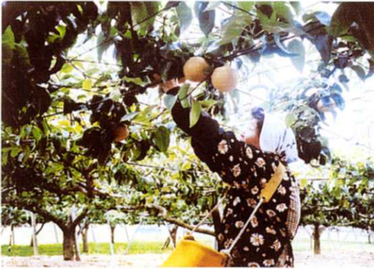
しゅうかくのようす