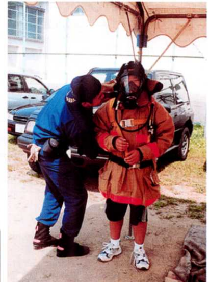
ずっしりと重いな。