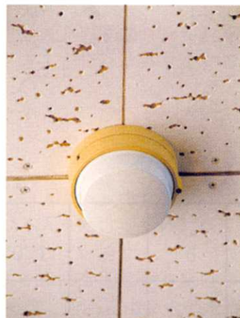
ねつ き 熱かんち器