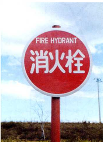
道路にある消火せん