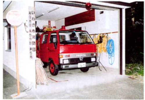
消ぼう団きかい庫