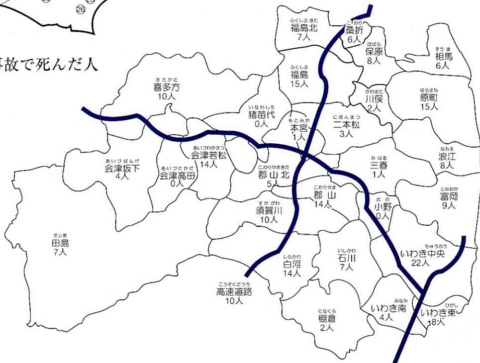
県内の交通事故で死んだ人