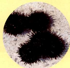
とれたばかりのうに