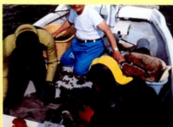
④ 小さいものは海にかえす