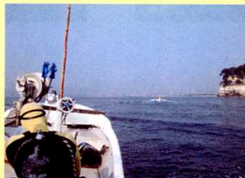
② 漁のポイントに向かう