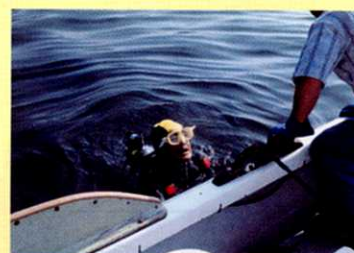
③ 海にもぐりうにをとる