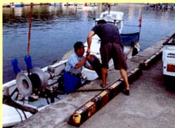
① りょう 漁のじゅんびをする