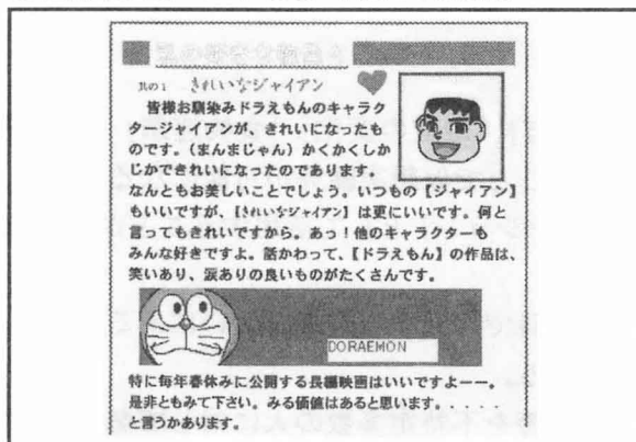
生徒新聞『アニメ的なデザイン』