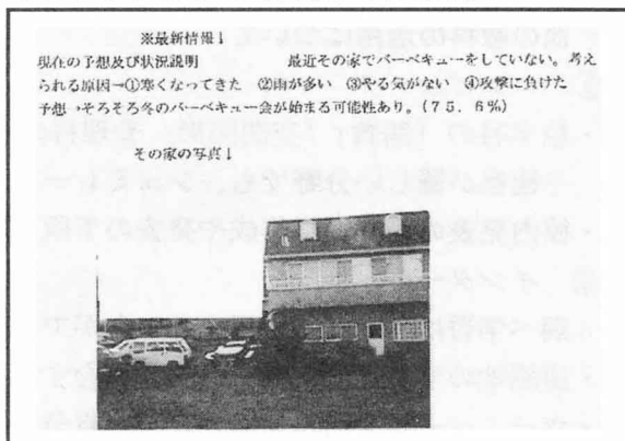
生徒新聞『自宅風景を撮影』