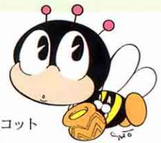
生涯学習のマスコット 「マナピィ」

Q21 今度、地区で運動会をやるのですが、適当な場所がありません。小学校の校庭を使わせてもらえませんか。