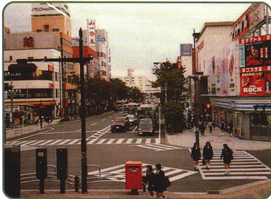
7-1 えきまえ 駅前のにぎやかなようす