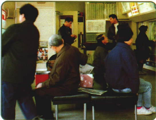
7-4 バス待ち合い室でバスを待つ人