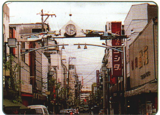
7-2 えきまえしょうてん 駅前商店がいのようす