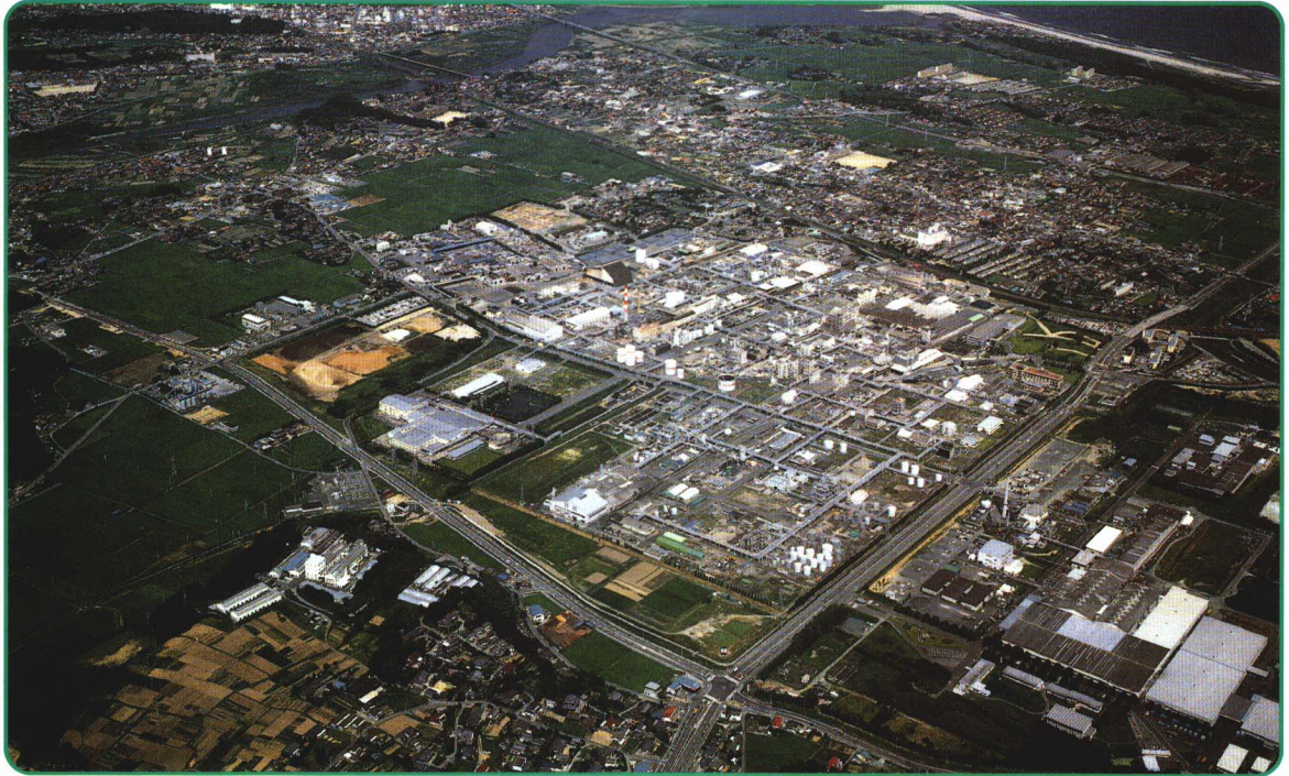
くれはかがくにしきこうじょう (呉羽化学錦工場)