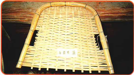
⑦炭 たん 鉢 こう で使 み った箕 ●石炭をふるい分けたり、運んだりするのに使いました。