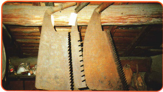
⑤のこぎり ●木の太さや切り方によって、のこぎりを使い分けました。