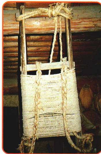
⑥やせんま ●農家の仕事で、まきや稲などをせおって運びました。