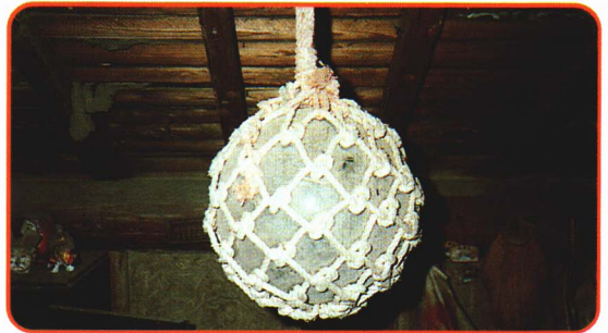
⑧うき ●あみのはしにたくさんつけて、魚をとる仕事に使いました。