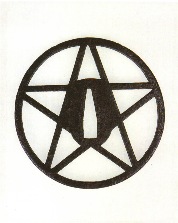
14 阿部清明判紋透鐺 無銘 甲冑師 丸形・角耳小肉・鉄地 室町時代前期 厚さ5.0×縦99.5×横99.0mm