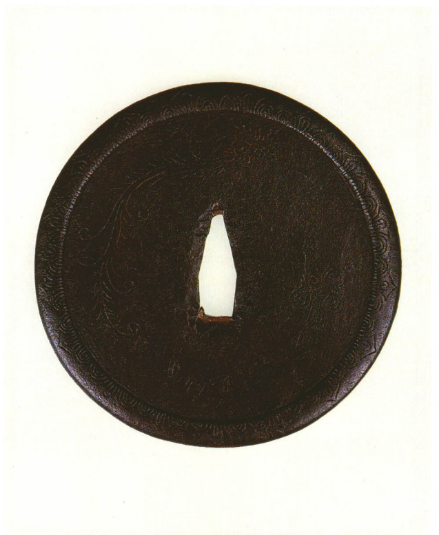
15 雲龍・渦巻・角巻凶鐺 無銘 甲冑師 丸形・環耳・鉄地 室町時代前期 厚さ2.3×縦95.0×横95.0mm