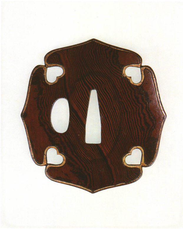
12 木目・猪目透鐺 無銘 太刀金具師 葵形・真鍮糸覆輪耳・素銅地 厚さ4.2×縦75.5×横71.0mm