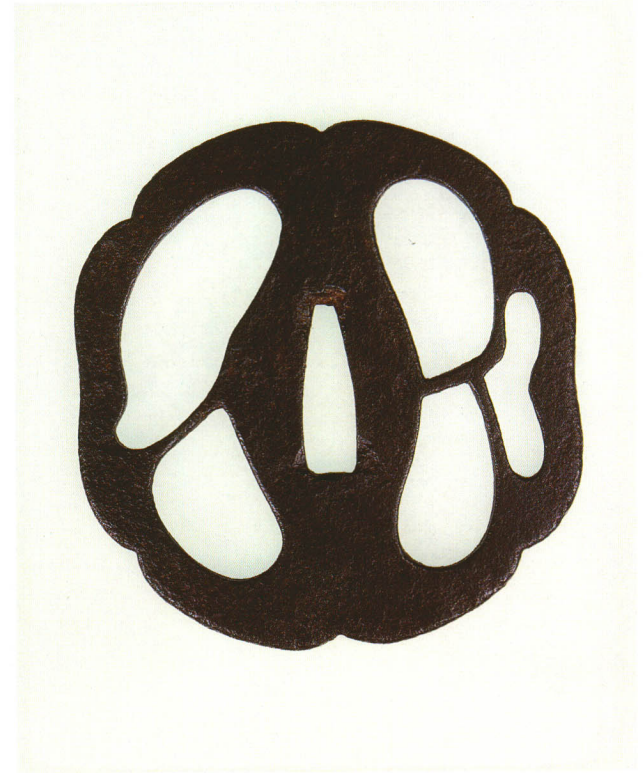
19 陰蝶透鐺 無銘 甲冑師 崩れ八木瓜形・丸耳・鉄地 室町時代中期 厚さ3.3×縦89.0×横83.0mm