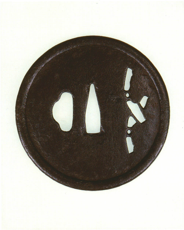
16 鉈透鐺 無銘 甲冑師 丸形・土手耳・鉄地 室町時代中期 厚さ2.4×縦91.0×横90.2mm