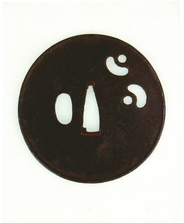
17 括猿透鐺 無銘 甲冑師 丸形・丸耳共覆輪・鉄地 室町時代中期 厚さ2.6×縦90.6×横90.0mm