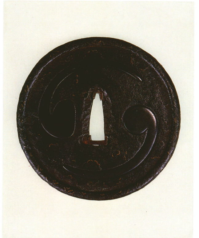
23 巴図鐺 無銘 甲冑師 丸形・土手耳・鉄地・巴赤銅象嵌 室町時代 厚さ3.0×縦84.5×横85.0mm