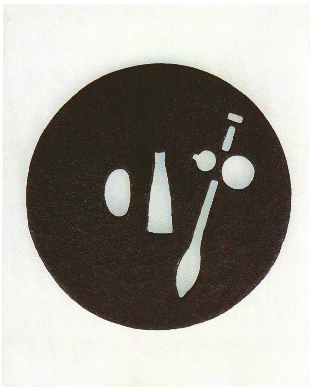
30 瓢箪と權透罎 無銘 甲冑師 丸形・角耳小肉・鉄地 厚さ3.5×縦101.5×横100.7mm