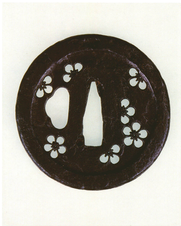
37 梅透鐺 無銘 甲冑師 丸形・環耳・鉄地 厚さ3.0×縦72.0×横71.0mm