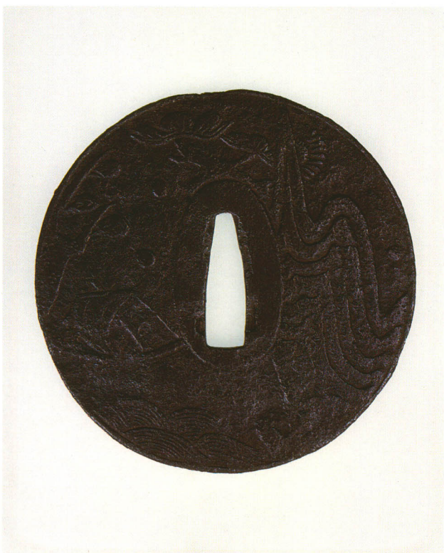
38 山水に帆掛舟図鐺 無銘 鎌倉 丸形・丸耳・鉄地 室町時代前期 厚さ3.0×縦94.0×横93.0mm