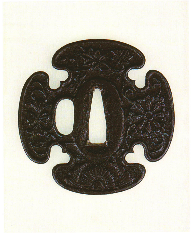
41 菊丁字図鐙 無銘 鎌倉 猪目木瓜形・角耳小肉・鉄地 室町時代後期 厚さ3.0×縦74.8×横75.2mm