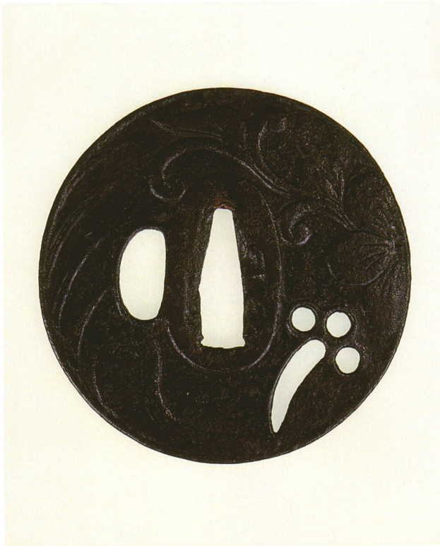
42 丁字透鐙 無銘 鎌倉 丸形・角耳・鉄地・梅鋤出し 室町時代後期 厚さ2.8×縦77.0×横76.0mm