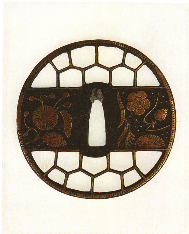
46 亀甲透鐔 無銘 応仁 丸形・角耳小肉・鉄地・菊花・唐草等真鍮象嵌 室町時代中期 厚さ3.5×縦84.5×横84.3mm