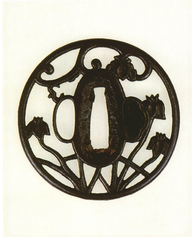
58 菖蒲に蕨手透鐔 無銘 京透 丸形・丸耳・鉄地 桃山時代 厚さ5.1×縦73.6×横73.3mm