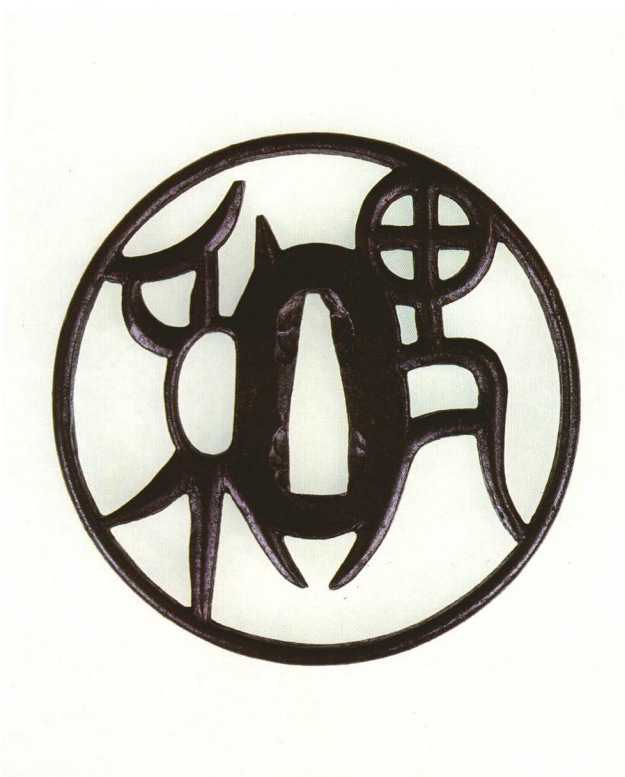
63 稗の文字透鐺 無銘 京透 丸形・角耳小肉・鉄地 江戸時代初期 厚さ5.0×縦77.0×横76.0mm