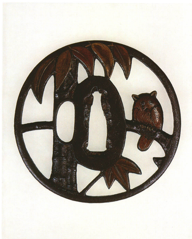
60 竹に鳥透鐺 無銘 京透 丸形・丸耳・鉄地 桃山時代 厚さ4.3×縦76.4×横78.0mm