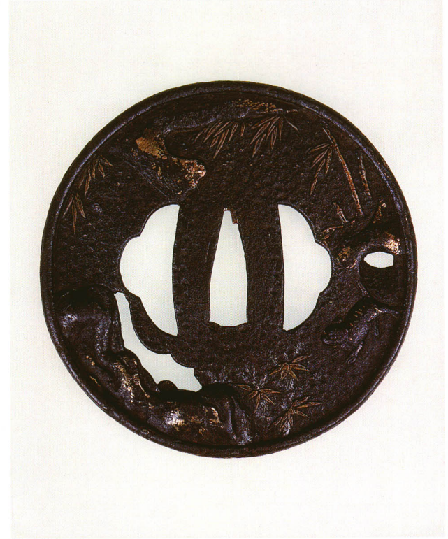
75 竹林虎図鐺 無銘 平安城象嵌 丸形・角耳小肉・鉄地・金銀布目象嵌大栗石目打 室町時代中期 厚さ2.7×縦94.0×横94.0mm