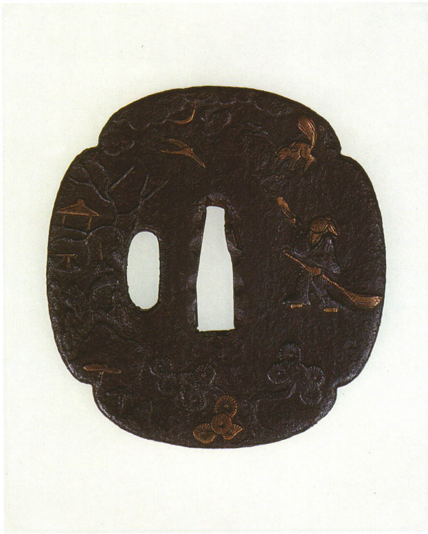
80 人物山水図鐺 無銘 平安城象嵌 木瓜形・角耳小肉・鉄地・金象嵌 室町時代 厚さ3.6×縦81.0×横76.0mm