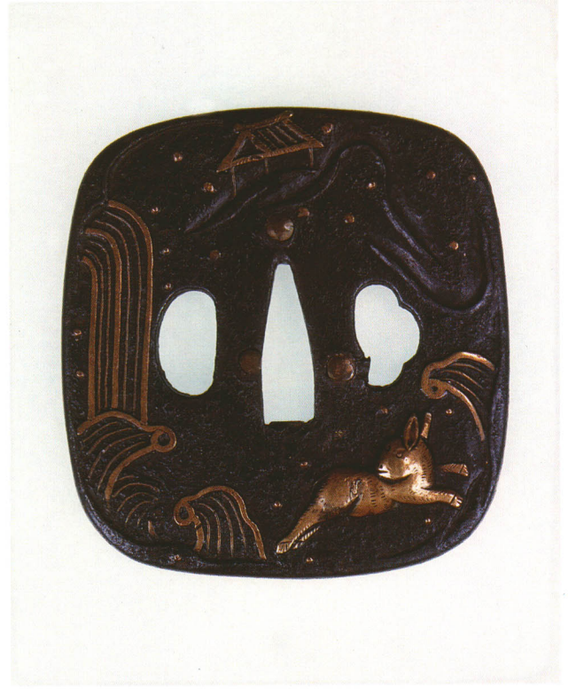
81 浪に兎図鐺 無銘 平安城象嵌 隅切角形・角耳小肉・鉄地・浪に兎据文真鍮象嵌 室町時代後期 厚さ5.4×縦77.0×横73.0mm