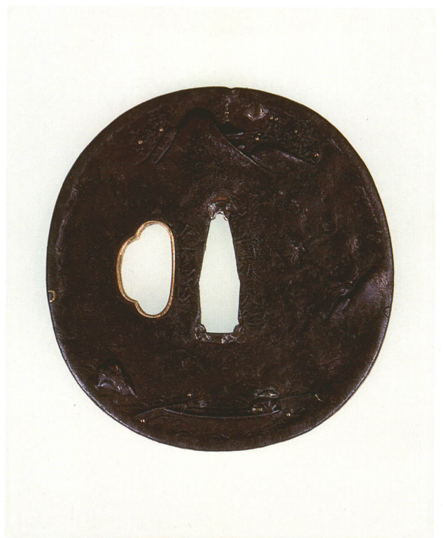
101 遠山に釣人図鐶 銘山城国伏見住 金家 長丸形・丸耳鋤残し・鉄地・月笠銀象嵌 桃山時代 厚さ3.4×縦84.4×横80.0mm