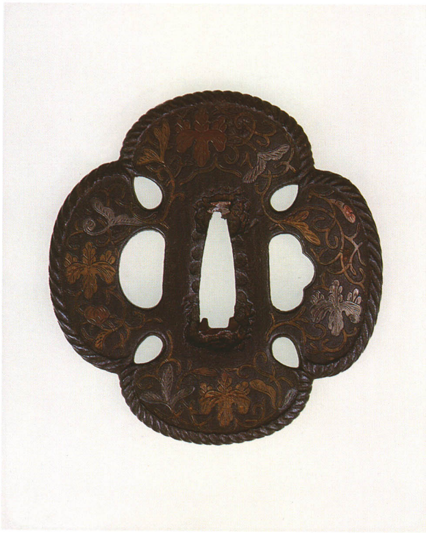
100 四方猪目透鐶 無銘 与四郎 木瓜形・丸耳・鉄地・唐草・桐銀素銅真鍮象嵌 厚さ5.0×縦72.0×横68.0mm