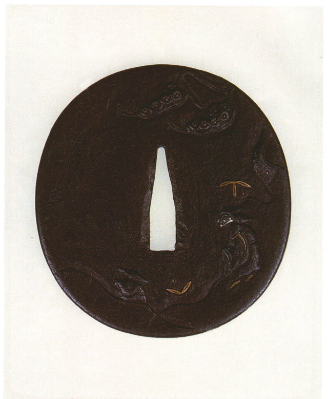
103 松下道士図鐶 銘山城国 藤原金定 長丸形・丸耳・鉄地 江戸時代初期～中期 厚さ3.3×縦88.0×横81.8mm