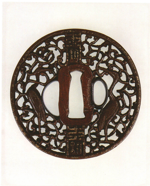
110 龍と鷺透鐺 無銘 南蛮 丸形・角耳小肉・銅地 江戸時代中期 厚さ7.3×縦80.3×横80.0mm