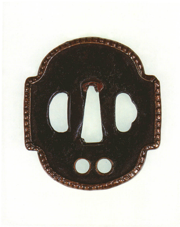
108 左右窓鐺 無銘 南蛮 変形・真鍮覆輪耳・銅地 桃山時代初期 厚さ3.9×縦75.6×横68.0mm