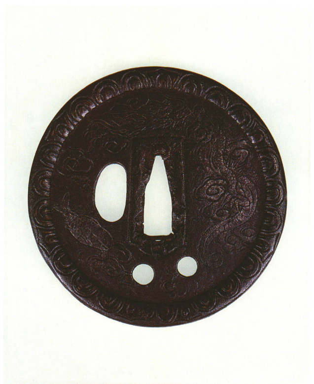
109 雲龍と魚図鐺 無銘 南蛮 丸形・土手耳・青銅地・紋は毛彫の上に金銀布目 江戸時代初期 厚さ2.3×縦89.6×横89.0mm