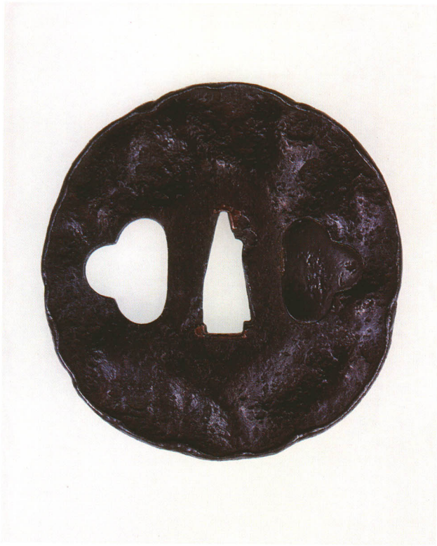
116 地大槌目鐺 無銘 古埋忠 丸形・打返し耳・鉄地・両大室片室赤銅埋 室町時代 厚さ3.2×縦80.0×横76.0mm