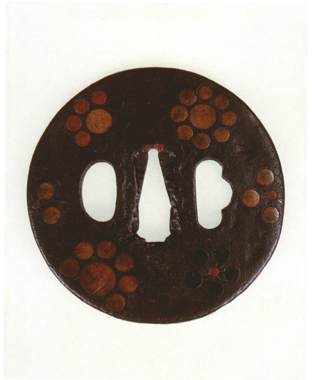
117 九曜紋鐺 無銘 古埋忠 丸形・角耳小肉・鉄地・色金平象嵌 桃山時代 厚さ4.5×縦78.0×横78.0mm