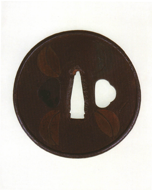
118 四ツ葉図鐺 無銘 古埋忠 丸形・丸耳共覆輪・鉄地・四ツ葉素銅平象嵌 桃山時代 厚さ3.1×縦83.7×横83.4mm