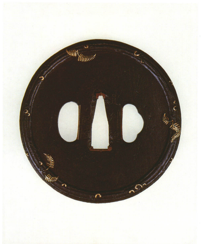
133 歯朶飾鐔 銘 武州住 正恒 丸形・丸耳角味・鉄地 江戸時代中期 厚さ3.0×縦83.0×横82.0mm