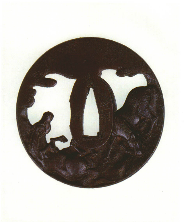
135 馬地透鐔 銘 武州住 吉重作 丸形・角耳小肉・素銅地 厚さ5.4×縦81.0×横79.4mm