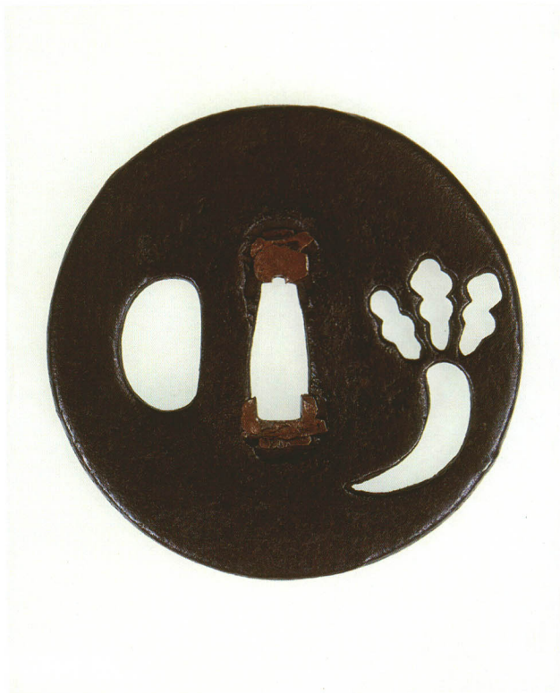
136 大根透鐺 無銘 古正阿弥 丸形・角耳小肉・鉄地 室町時代 厚さ3.6×縦71.0×横71.0mm