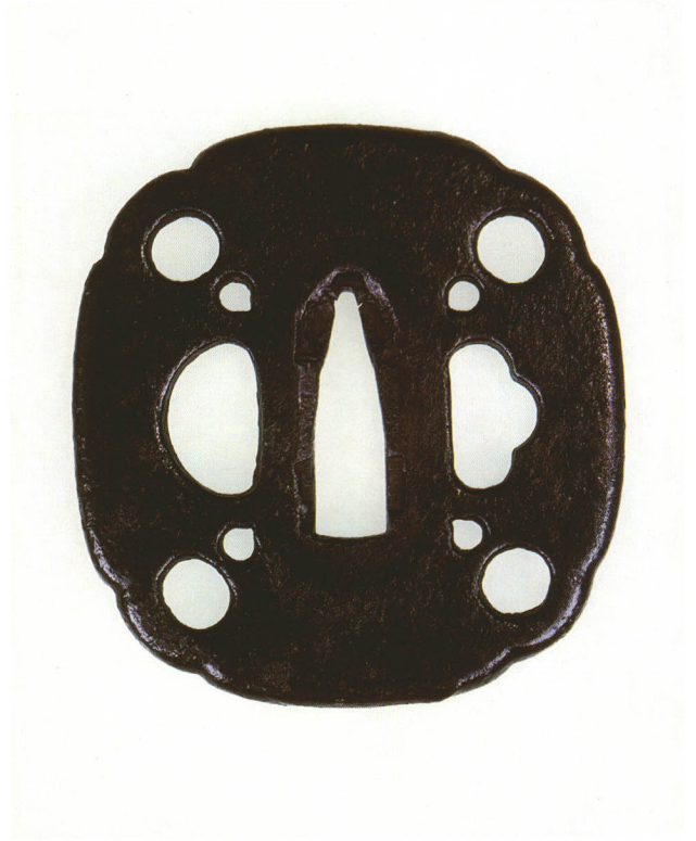
137 四方瓢箪透鐺 無銘 古正阿弥 変り形・丸耳・鉄地 室町時代 厚さ4.4×縦69.0×横65.4mm