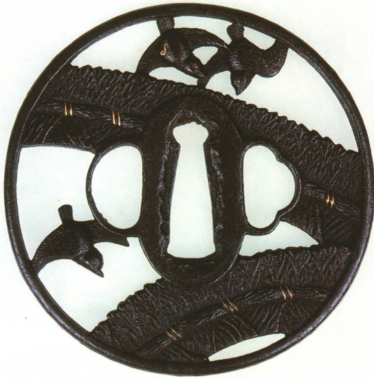
140 雀に柴垣透鐺 無銘 古正阿弥 丸形・角耳小肉・鉄地 江戸時代中期 厚さ4.7×縦80.4×横80.0mm