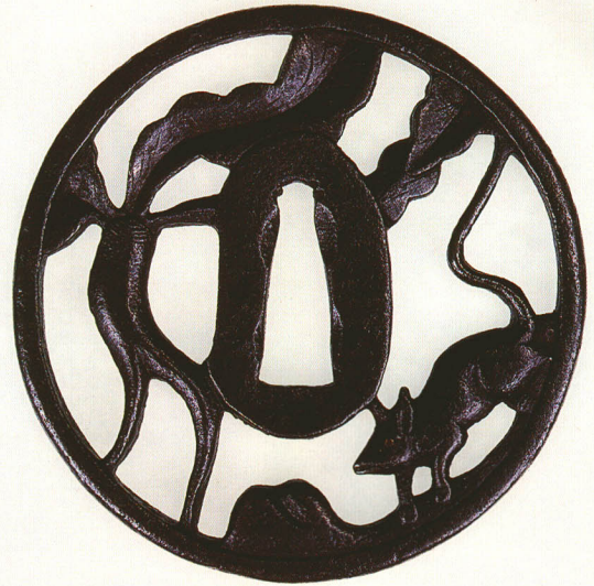
143 大根・鼠透鐺 無銘 京正阿弥 丸形・角耳小肉・鉄地・生透し 桃山時代 厚さ4.6×縦78.0×横77.0mm