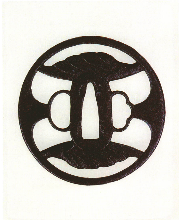
147 茶箒透鐺 無銘 京正阿弥 丸形・角耳小肉・鉄地 江戸時代中期 厚さ4.5×縦78.0×横77.0mm