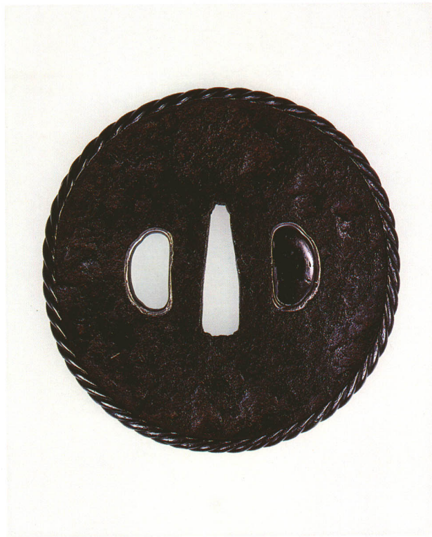
145 槌目地鐺 銘正阿弥 長吉 丸形・赤銅繩目覆輪・鉄地 江戸時代初期 厚さ4.3×縦84.0×横82.0mm