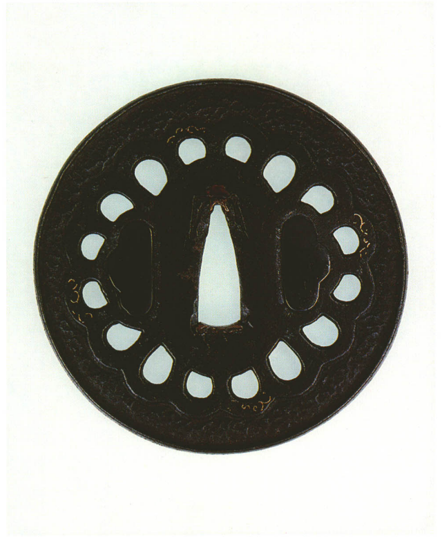
153 菊透鑄 無銘 京正阿弥 丸形・鋤残し耳・鉄地 厚さ4.5×縦80.6×横80.4mm