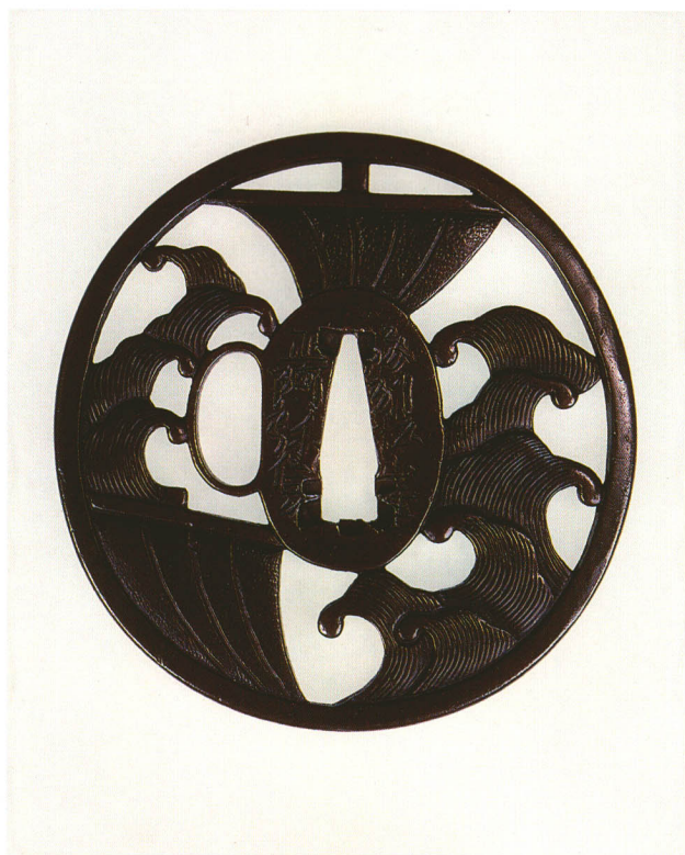
157 立浪に帆透鐔 銘 予州松山住 正阿弥信久 丸形・丸耳角味・山銅地 江戸時代中期 厚さ4.2×縦84.0×横82.0mm