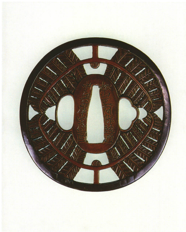
156 蕨透鐔 銘 松山正阿弥惣匠 中奥開山盛国 丸形・赤銅覆輪・素銅地 正徳六年二月 厚さ4.8×縦82.5×横81.1mm