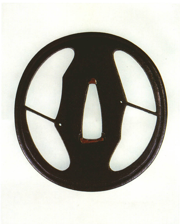
159 影蝶透鐔 無銘 西垣 丸形・丸耳・鉄地 江戸時代初期 厚さ3.9×縦82.0×横79.0mm