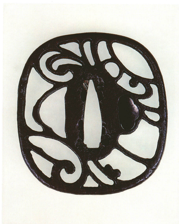
173 流水透鐔 無銘 金山 撫角形・角耳小肉・鉄地 室町時代後期 厚さ7.0×縦72.0×横67.0mm