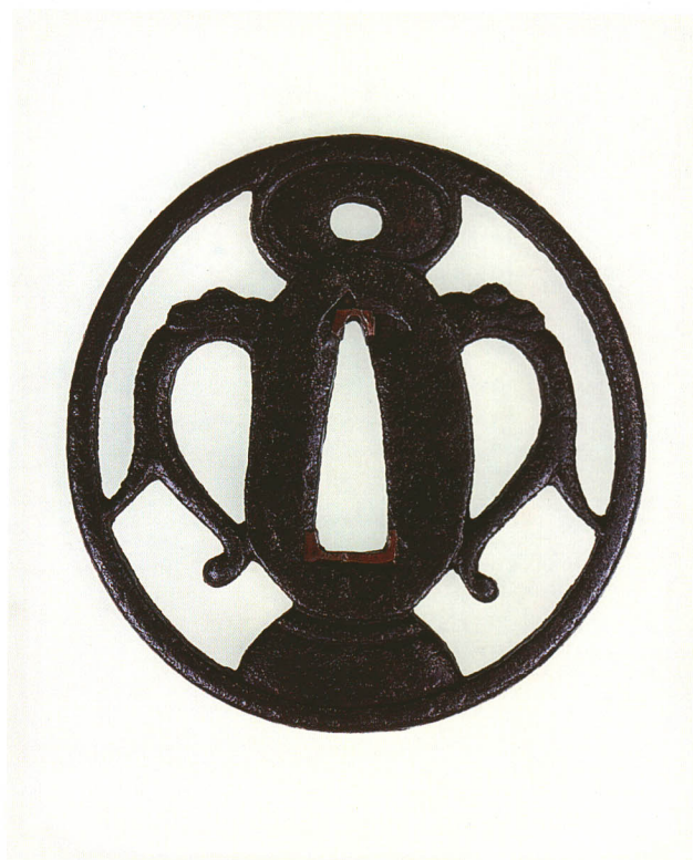
174 小瓶子透鐔 無銘 金山 丸形・角耳小肉・鉄地 室町時代後期 厚さ4.4×縦67.0×横65.0mm