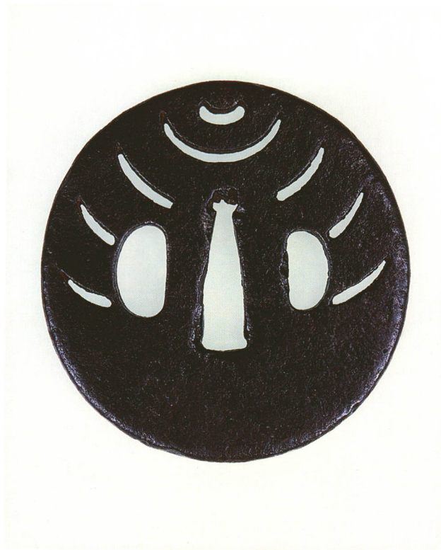
172 宝珠透鐔 無銘 金山 丸形・丸耳角味・鉄地 室町時代中期 厚さ6.0×縦72.0×横69.6mm