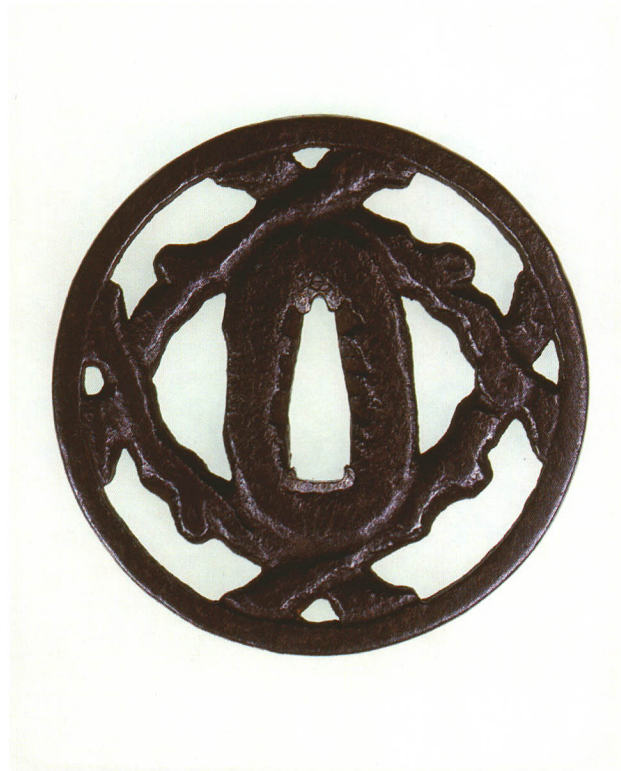
187 木井桁生透鐮 無銘 柳生 丸形・角耳小肉・鉄地 江戸時代中期 厚さ5.0×縦75.0×横74.4mm