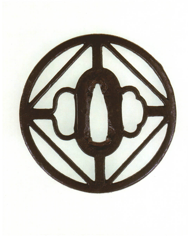
185 枅形透鐮 無銘 尾張透 丸形・角耳小肉・鉄地 厚さ4.8×縦78.0×横77.0mm