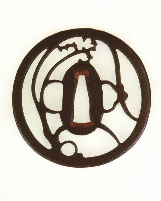
184 將軍草透鐮 無銘 尾張透 丸形・角耳小肉・鉄地 厚さ5.0×縦79.8×横79.3mm