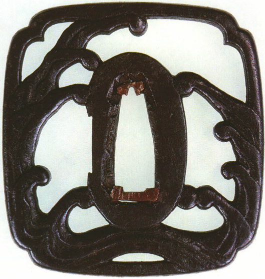
188 立浪透鐔 無銘 柳生 隅入角形・角耳小肉・鉄地 江戸時代中期 厚さ6.5×縦65.0×横62.0mm