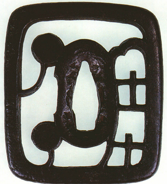
191 書院窓・お玉抱透鐔 無銘 柳生 撫長角形・角耳小肉・鉄地 厚さ7.7×縦71.4×横62.0mm