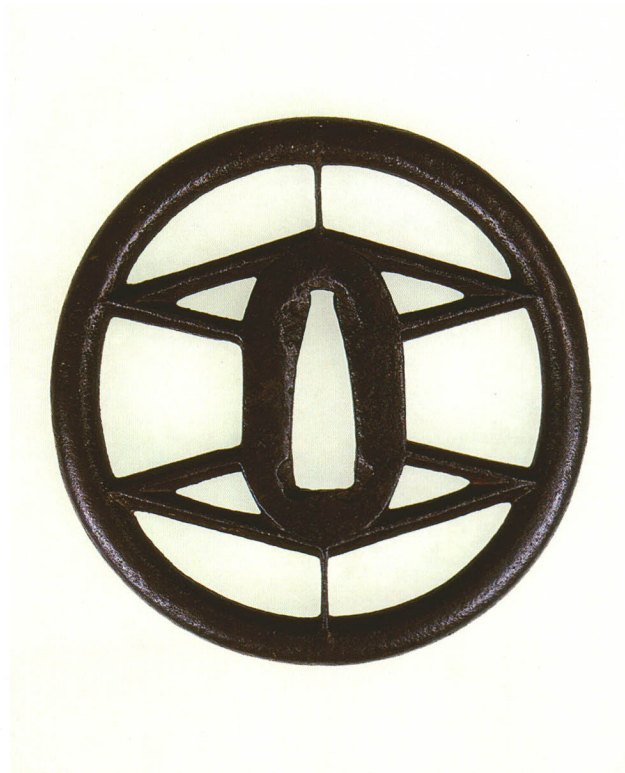
194 二階菱透鐺 無銘 初代赤坂 丸形・土手耳・鉄地 江戸時代初期 厚さ6.4×縦78.7×横77.0mm