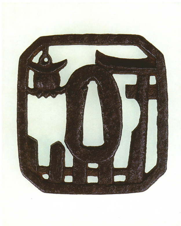
192 春日神社透鐺 無銘 柳生 隅切角形・角耳・鉄地 厚さ6.2×縦65.3×横62.0mm