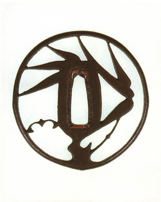
198 笹透鐔 無銘 赤坂 丸形・丸耳・鉄地 江戸時代中期 厚さ5.6×縦80.0×横78.4mm