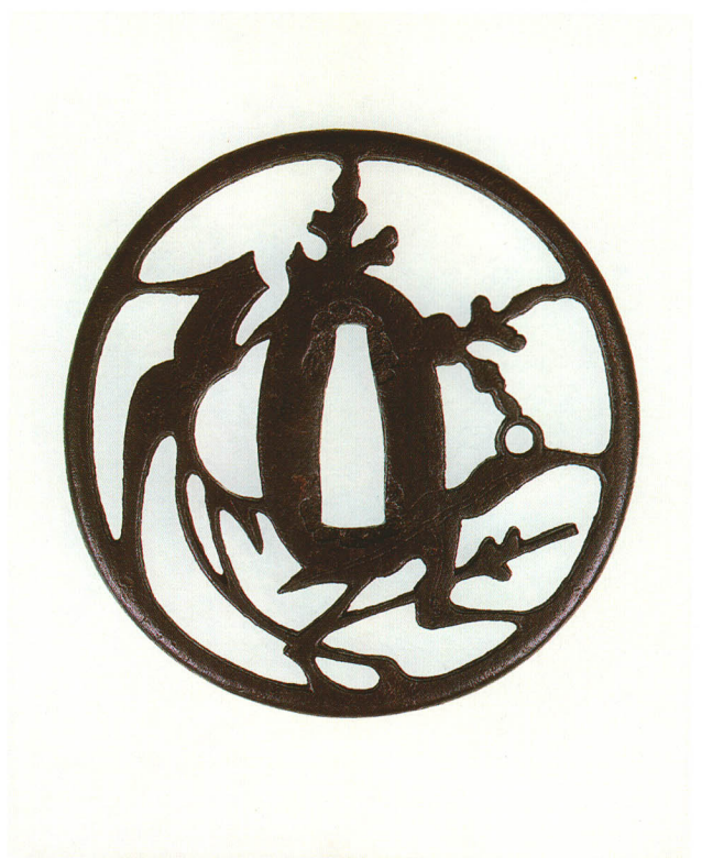
197 將軍草透鐔 無銘 赤坂 丸形・丸耳・鉄地 江戸時代中期 厚さ5.5×縦79.5×横77.5mm