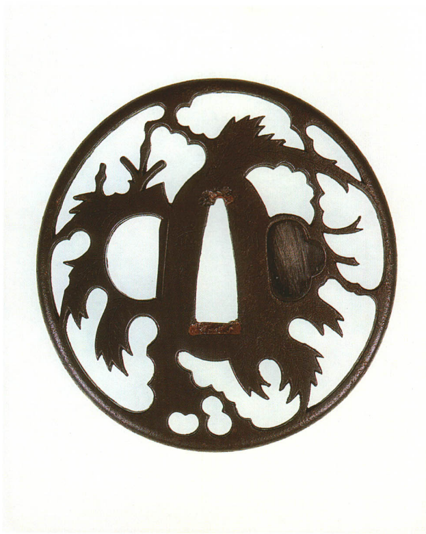
196 踊桐透鐔 銘 赤坂 忠時作 丸形・丸耳・鉄地 江戸時代中期 厚さ5.3×縦76.0×横73.3mm